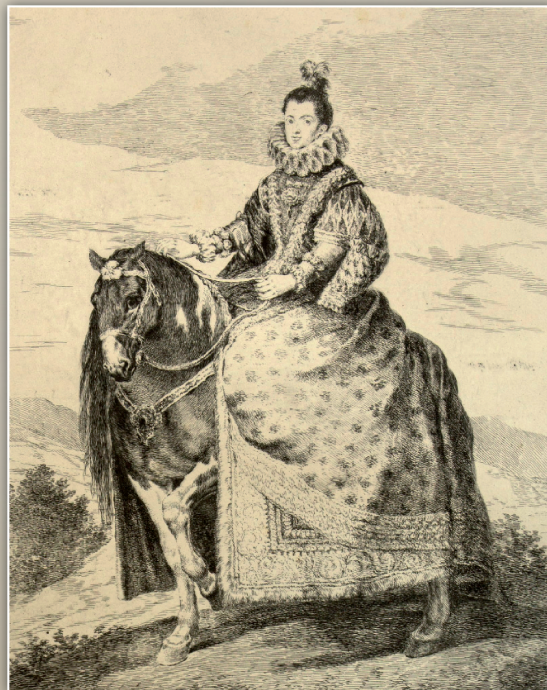
"Margarita de Austria". Grabador: Francisco de Goya sobre cuadro de Diego Velázquez (1778)