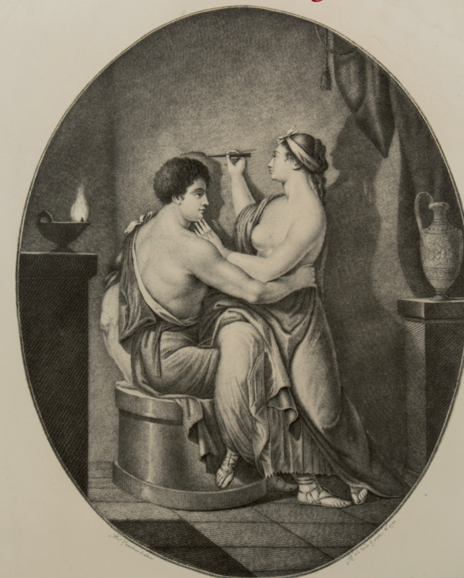
Origen de la Pintura.

Recuerdo de la tabla del mismo tamaño que, aunque se agotó el resto, se conserva en el Museo de la Real Academia de San Fernando.